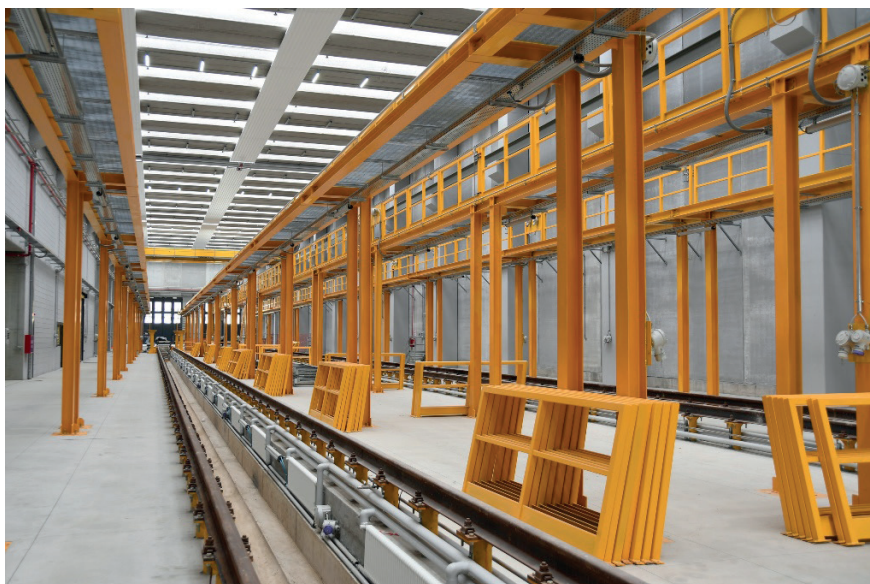
Figura 2 - Il nuovo impianto per la manutenzione dei treni ad idrogeno di Rovato.