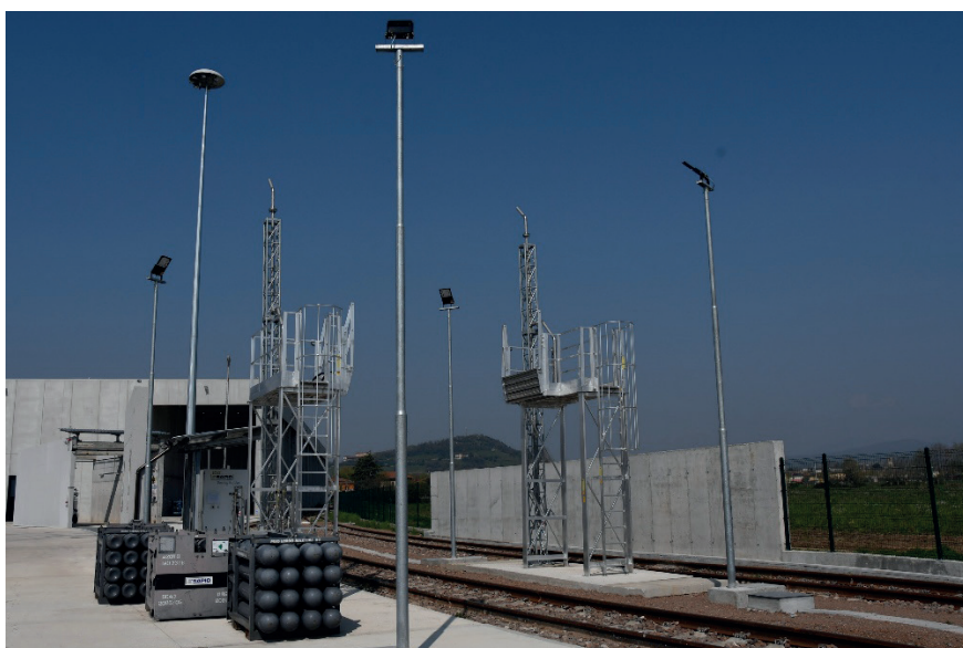
Figura 3 - Impianto rifornimento idrogeno a Rovato.

dere solo a piccoli rifornimenti per attività manutentive che necessitano dello svuotamento dei serbatoi dei treni.