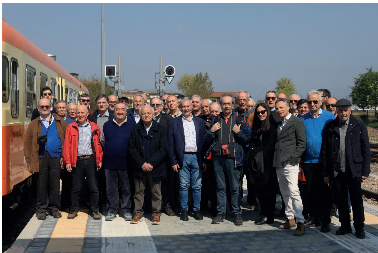
Figura 1 – I partecipanti alla visita tecnica.

In particolare, in questo sito, il rifornimento di idrogeno è previsto esclusivamente mediante utilizzo del "carro bombolaio" dovendosi provve-