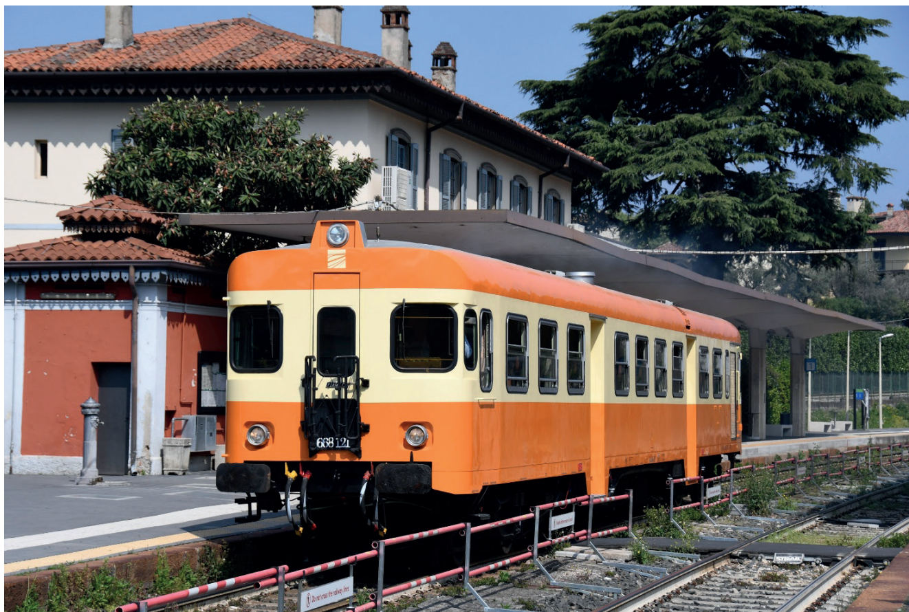
Figura 4 - L'automotrice storica Aln 668.121.