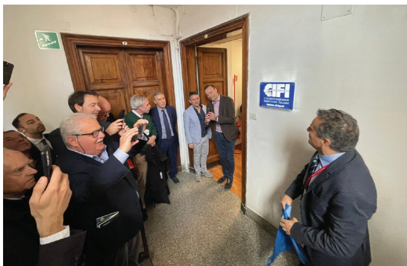
Figura 2 – Momento della presentazione della targa che rappresenta la nascita della Sede CIFI di Napoli.

con un ricordo della Giornata dall'attuale Preside di Sezione: