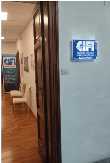
Figura 3 – Immagine di entrata della Sede CIFI di Napoli.